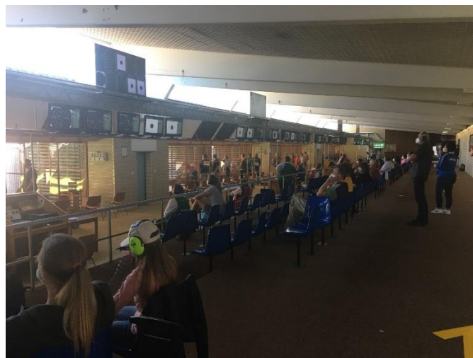
Blick in die 25m Halle im laufenden Wettbewerb KK-Sportpistole